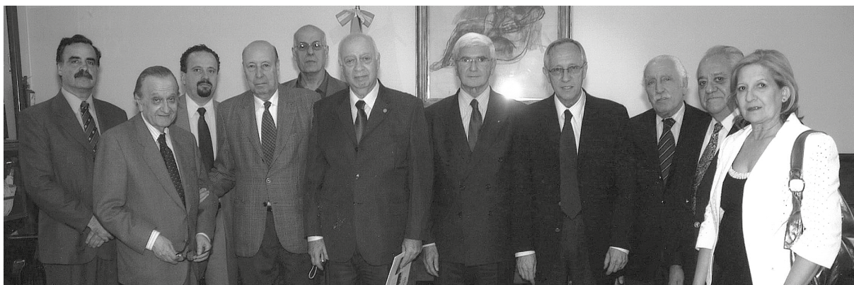
Jornadas AMFA-CECTAF en Buenos Aires, 2013. Firma Acuerdo de trabajo AMA-AMFA-CECTAF. Presidentes y comisiones directivas de las tres instituciones.