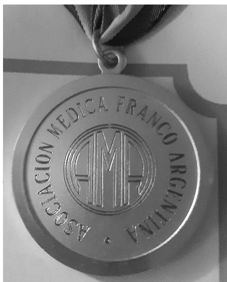
Medalla de Oro de la AMFA para los Miembros de Honor, entregada en el 2005.