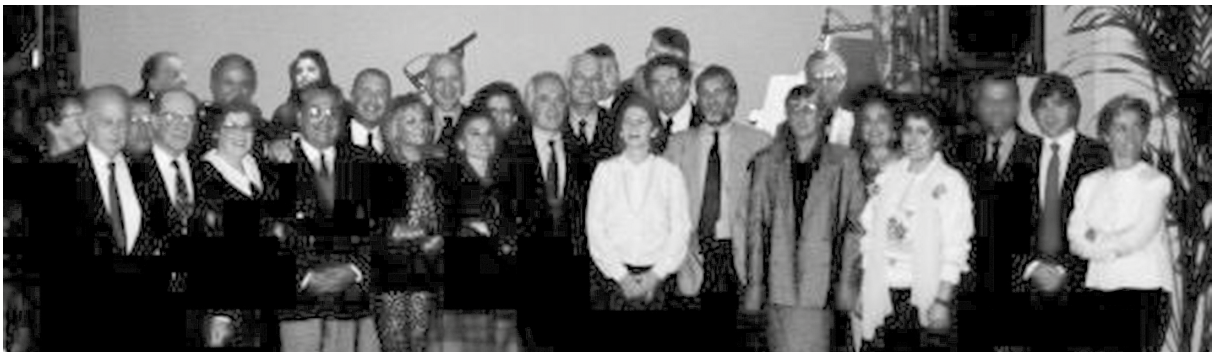
Un grupo de asistentes a la Tercera Jornada de AMFA, en Toulouse, octubre de 1992.