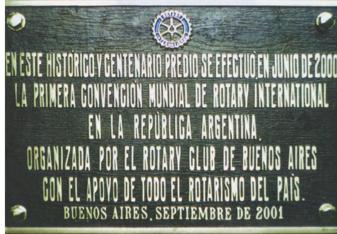
Placa colocada en una pared de la Sociedad Rural.

Ya pasada la Convención se editó un libro con todo lo actuado. El Comité Editorial de las Memorias, estuvo integrado por: